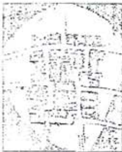
A.C. La Marinada

Res més, mostrar una vegada més la nostra decepció pel tracte que se'ns dona, atentament,