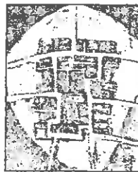
A.C. La Marinada

SEGON.- Que es declari la nul·litat absoluta de l'esmentada resolució , es suspengui la seva executivitat i es deixi sense efecte.